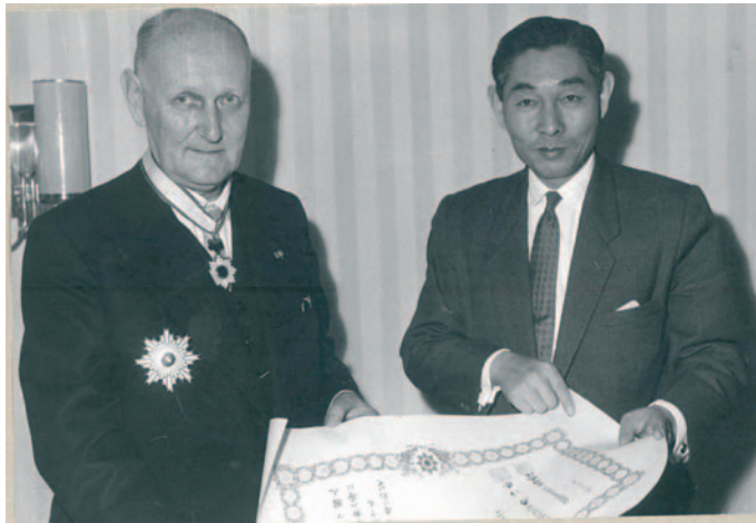
links: Prof. Dr. Gerhard Domagk

Einer der berühmtesten Bildhauer der heutigen Avantgarde ist Tony Cragg (1949 in Liverpool geboren), der in Wuppertal seit mehr als 20 Jahren seine große Werkstatt hat. Wilhelm Dörpfeld (1824 bis 1893) war ein berühmter Reformpädagoge; sein ältester Sohn Wilhelm Dörpfeld (1853 bis 1940) wurde Architekt und Altertumsforscher und leitete die Ausgrabungen an der Stelle, an der Heinrich Schliemann Troja vermutete.